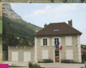
Saint Paul de Varces