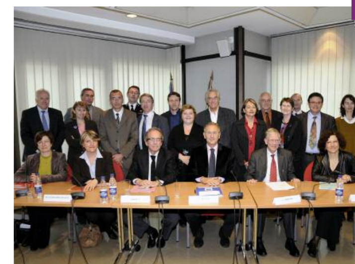
Signature du protocole partenarial avec le Préfet, la Justice, l'Éducation Nationale, les forces de police et de gendarmerie, et les associations spécialisées, le 27 avril 2009

Le Conseil général est le point de convergence de toutes ces informations pour agir le plus vite et le mieux possible. C'est la cellule de recueil des informations préoccupantes. Elle sert aussi d'observatoire départemental qui va alimenter en bout de ligne l'observatoire national de l'enfance en danger. Ce protocole a été signé en Isère sans restriction par tous les partenaires concernés.