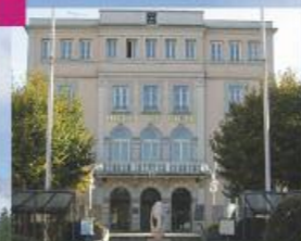
Pont de Claix